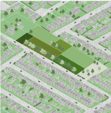
Stage I: Existing condition