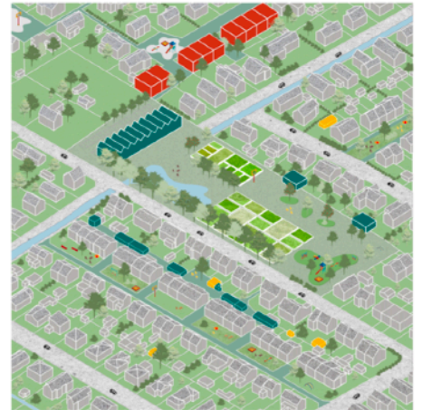
Stage III: Network/ Connection