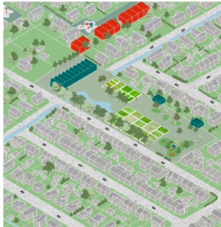
Stage II: Development begins