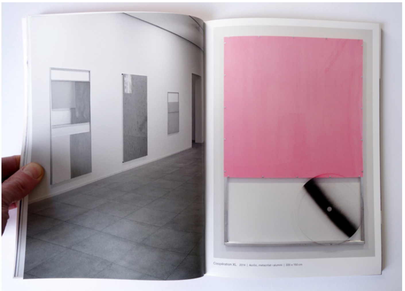
Nunca es suficiente fundació Suñol Barcelona, Espagne 2014