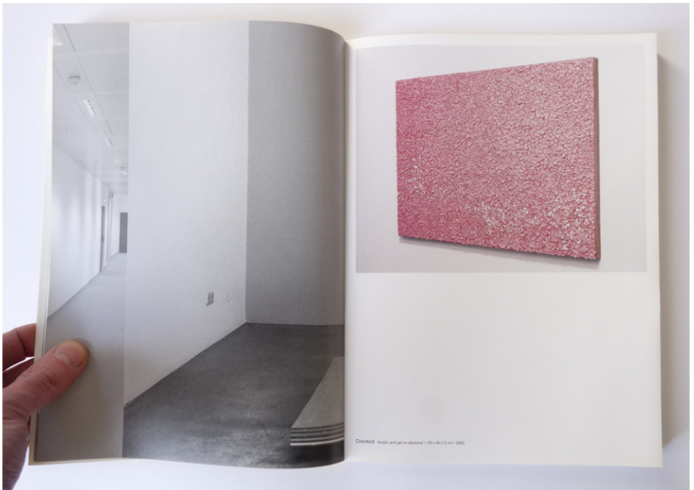
Monographie Roma Publications 2004